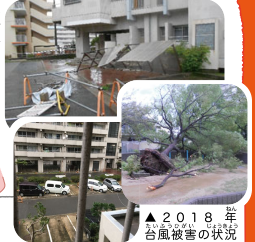
▲2018年台風被害の状況